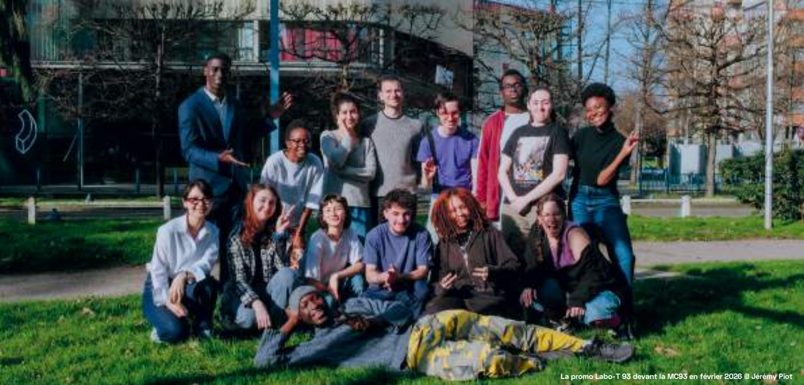
La promo Labo-T 93 devant la MC93 en février 2026