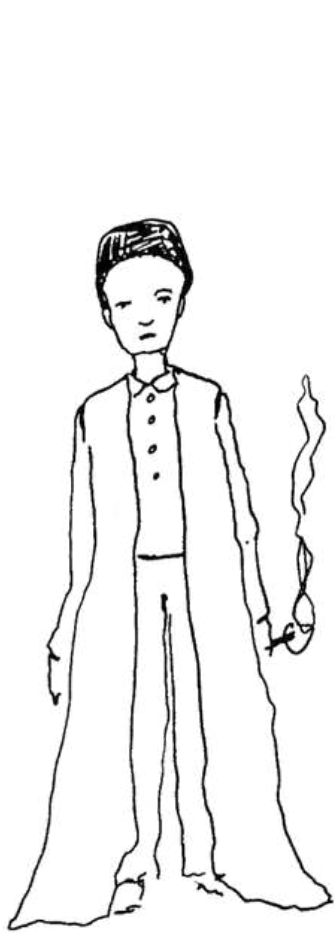
LE JEUNE MOLIERE