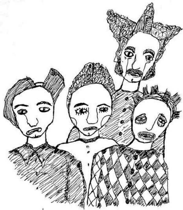
les Masques de l'ébaurdi

MASQUES EN TISSUS LELIE LEANDRE ANSELME MASCARILLE