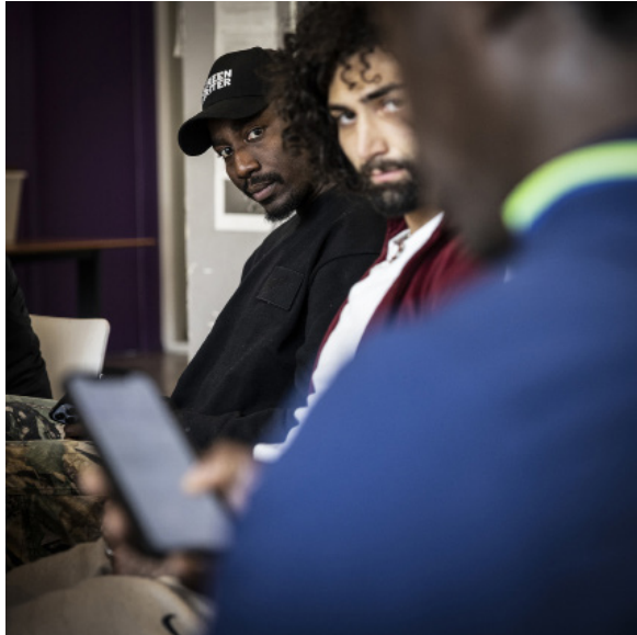
Atelier d'écriture à l'espace jeunesse de Nanterre, février 2025