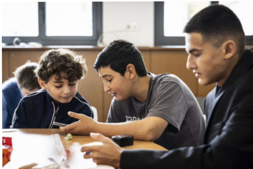
Atelier d'écriture à l'espace jeunesse de Nanterre, février 2025