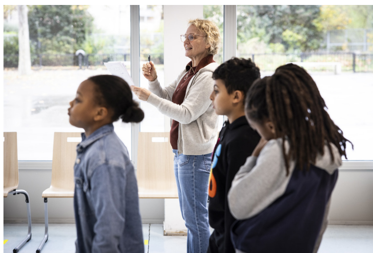
Répétitions en atelier dans les écoles, février 2025

Remerciements Collège Evariste Galois, Ecole des Pâquerettes, Ecole La Fontaine, Maison de l'Enfance