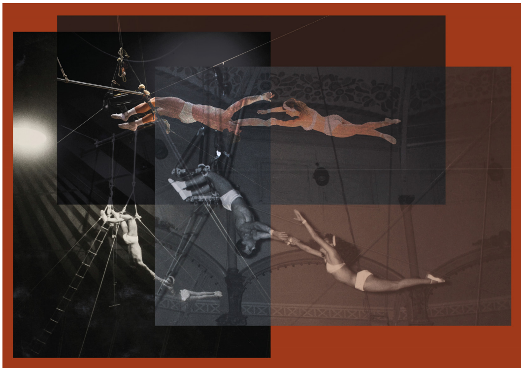
@ collage Axelle Gonay / fonds des Antinoüs-Pierre Dannès-Alain Julien

En racontant Suzanne, et en tirant de l'oubli son numéro-fétiche, Anna cherche ce qui résiste au passage des années. Que reste-t-il de nous, de nos risques, nos gestes, nos moments d'incandescence ? Que reste-t-il de nos beautés et nos perfections passées ? De la grâce et du temps, lequel abolit l'autre ?