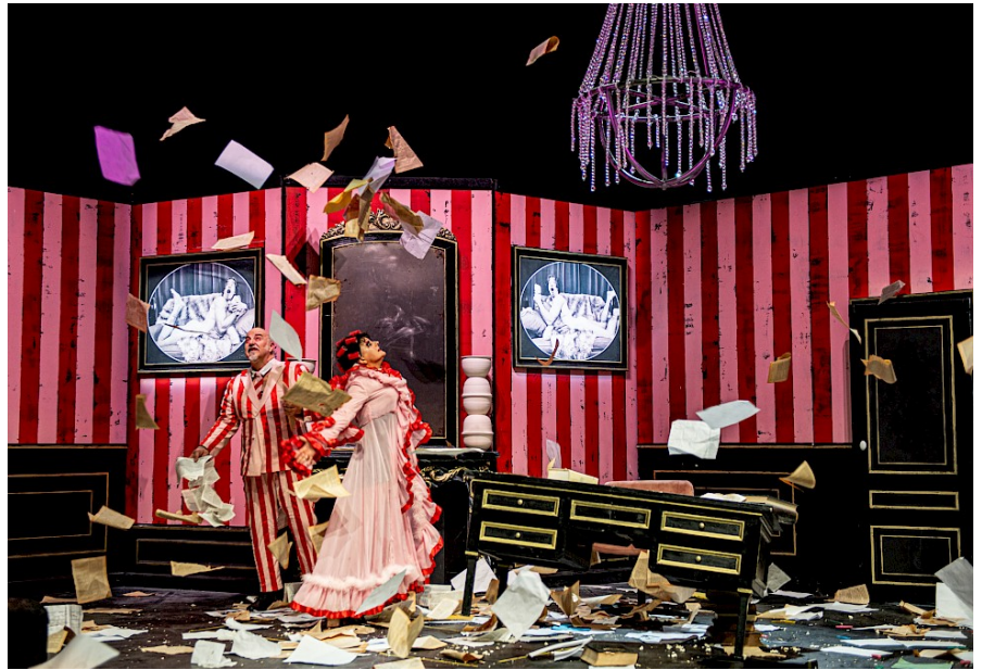
On purge bébé © Vahid Amanpour