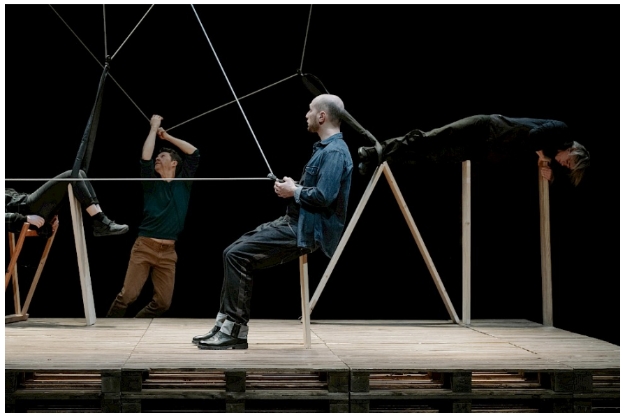
A vue. Magie performative

Nous avons imaginé ce « week-end tous azimuts » autour de la magie nouvelle comme un temps fort stimulant et décapant, un concentré de propositions qui ne laissera pas le public indemne. La magie se réinvente depuis une vingtaine d'années, multiplie ses approches et crée des voies de passage entre tradition et modernité. La cie 32 novembre revisite les plus gros numéros ancestraux de la magie enfin débarrassés de leur esthétisme « vieux monde ». Quant à la cie 14 :20, elle offre un florilège de séquences portées par des experts de leurs techniques : ombres portées, lévitation, cartes... Un grand voyage dans le trouble et la fascination que Céline Moulin, historienne de la magie, nous aidera à mieux appréhender à l'occasion d'une conférence.