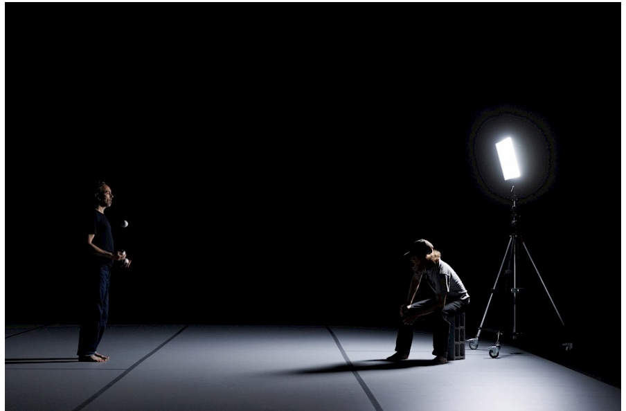
Commencer à exister