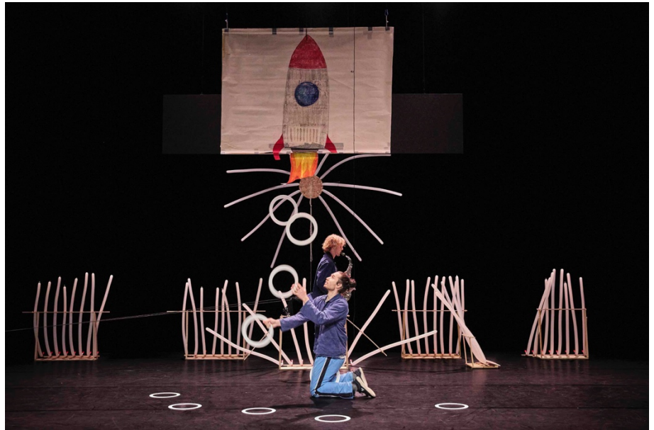
Metaphoric Objects (titre provisoire)

L'Espace Périphérique et circusnext participent à la 7ème édition de la Nuit du Cirque avec un rendez-vous sous le signe du jonglage ! Entre performances et atelier, découvrez les coulisses de la création avec Idriss Rocca et David Martin. Pour la première fois à cette occasion, l'Espace Périphérique s'ouvre au public !