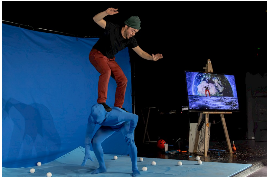
Nous on n'a rien vu venir

Cette saison, La Nuit du cirque au Prato se déploie sur 3 jours, mêlant spectacles, ateliers et présentation des numéros des écoles de cirque régionales, en articulation avec les acteurs « cirque » de la métropole lilloise, le Cirque du Bout du Monde et le Centre Régional des Arts du Cirque.