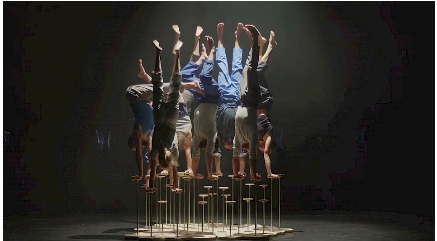
Le Complexe de l'Autruche

En Ile-et-Vilaine, La Nuit du Cirque dessine une grande constellation. Coordonnée par AY-ROOP , elle fédère des structures culturelles dans une dynamique collective et itinérante sur l'ensemble du département. Du cirque pour tous et sous toutes ses formes, pour offrir une vision à 360° des nouvelles écritures, aussi détonantes qu'enivrantes.