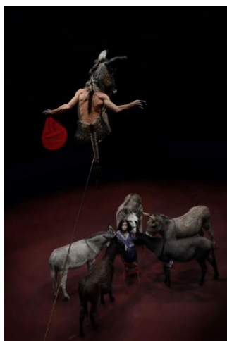
7/ Cabaret de l'Exil Femmes Persanes