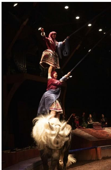
5/ Cabaret de l'Exil Femmes Persanes