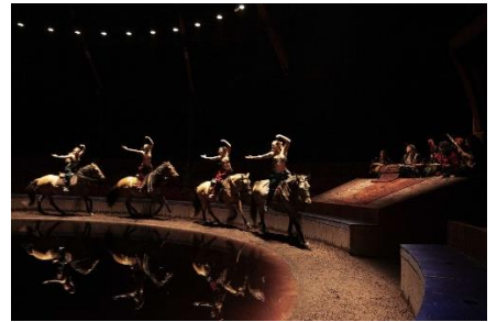
3/Cabaret de l'Exil Femmes Persanes