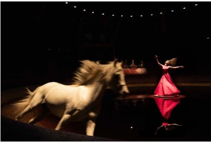
1/Cabaret de l'Exil Femmes Persanes