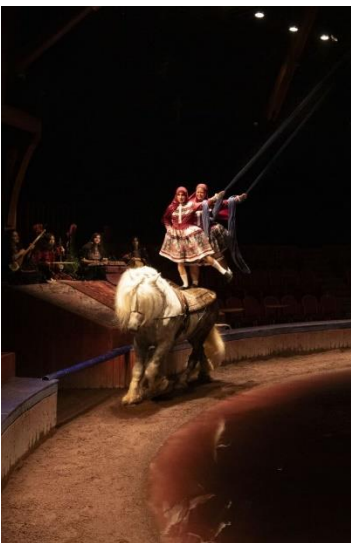
4/ Cabaret de l'Exil Femmes Persanes