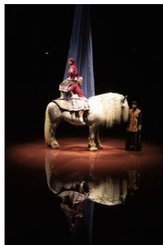
8/ Cabaret de l'Exil Femmes Persanes