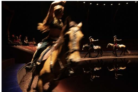
2/Cabaret de l'Exil Femmes Persanes